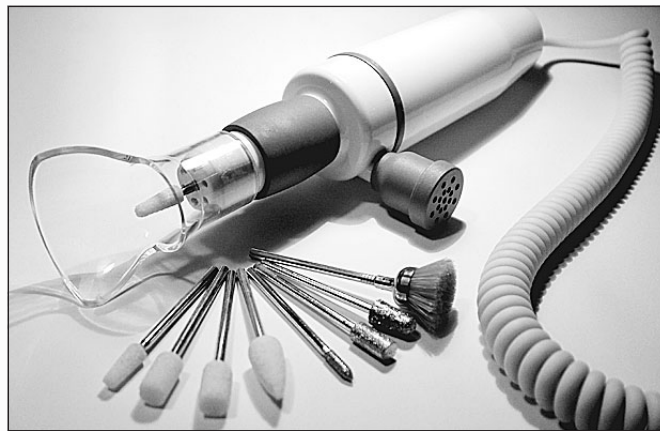
Weltneuheit: der Maniküreschleifer mit Absaugung.

Dass LEIBE KUNSTSTOFFTECHNIK diesen Ansprüchen gerecht wird, zeugt vom hohen Potenzial jedes Einzelnen, vom reibungslosen Ablauf in Zusammenarbeit und Entwicklung, von der Qualität im Werkzeugbau, in der Anwendungstechnik und Logistik.